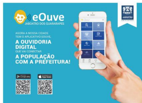
Imagem 03: Divulgação do aplicativo para registro de manifestações.