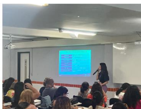
Imagem 07: Palestra Código de Conduta.

Além dos trabalhos de palestras a Corregedoria em conjunto com a Controladoria faz a emissão de boletins informativos com objetivo de orientar os servidores sobre normas, procedimentos, regulamentos e boas práticas de transparência, controle e integridade. As orientações podem ser acessadas no Portal