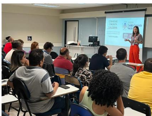
Imagem 06: Palestra Código de Conduta.

Esta ação consiste em um trabalho de prevenção através da realização das Palestras realizadas pela Corregedoria sobre o Código de Conduta dos Servidores de Jaboatão dos Guararapes (Decreto nº. 11 de 11/02/22), com o objetivo de disseminar diretrizes e princípios éticos que estabelecem as expectativas de comportamento e desempenho que os funcionários devem seguir no exercício de suas funções. O Código serve como um guia para promover um ambiente de trabalho ético, responsável, íntegro e profissional.