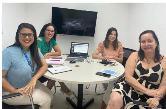
Imagem 05: Reunião com a Secretária Municipal de Saúde.