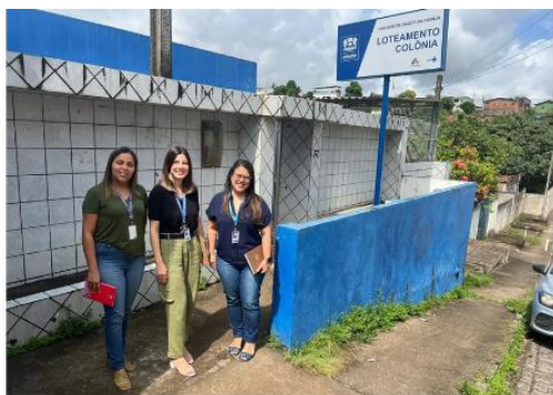
Imagem 04: Visita às Unidades denunciadas.

Após o envio do relatório para Secretaria é realizada a reunião com o gestor da pasta para apresentar as situações identificadas, sugerir melhorias e pactuar prazos para o atendimento das recomendações e/ou regularizar os indícios, com objetivo de garantir a correta prestação dos serviços.