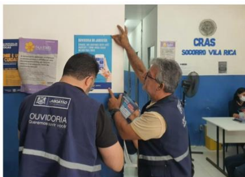
Imagem 02: Divulgação dos canais de atendimento da Ouvidoria no CRAS.

A Ouvidoria também realiza a divulgação deste canal nos espaços públicos municipais, para os servidores e população, além de publicações nas redes sociais.